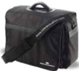
Malette de transport